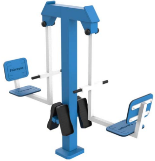
FIT-01D - Estiramiento de piernas