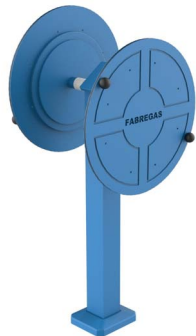
FIT-11D - El Circulo