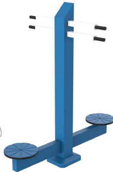
FIT-06D - El Volante