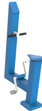
FIT-07 - La Bicicleta