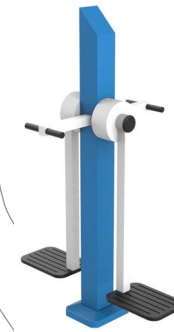
FIT-04D - La Vela