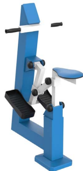
FIT-12 - El Caballo