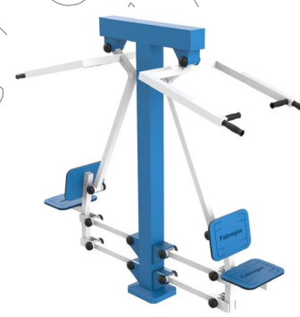
FIT-09D - Elevador