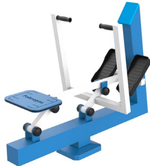
FIT-2 - Remo