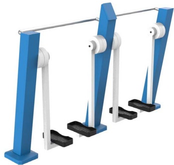
FIT-05D - Paseo doble