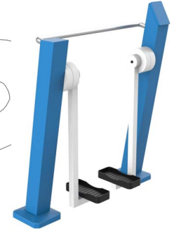
FIT-05 - Paseo simple