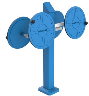
FIT-10D - Las Ruedas