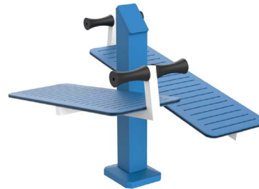
FIT-14D - Banco de Abdominales