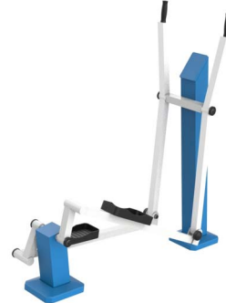
FIT-03 - Esquí de fondo