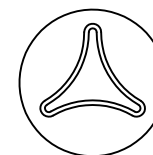
vista inferior 1:5