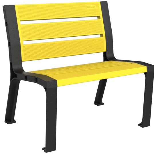
Imagen - 08PLAST-0860-AMA-SIN (Color amarillo)