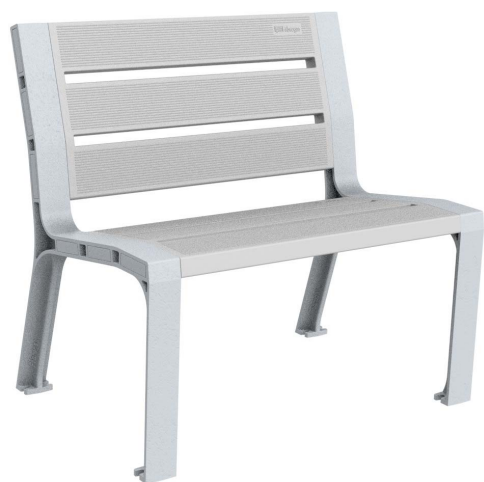
08PLAST-0860-PLA-SIN (Color plata)