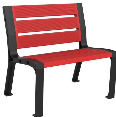
08PLAST-0860-ROJ-SIN (RAL 3020)