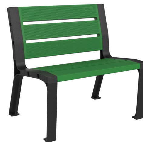
08PLAST-0860-VER-SIN (RAL 6029)