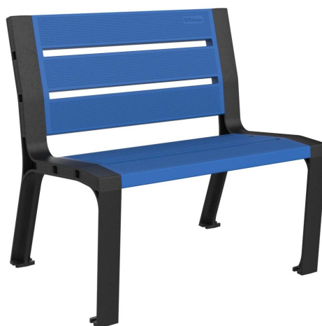
08PLAST-0860-AZU-SIN (RAL 5005)